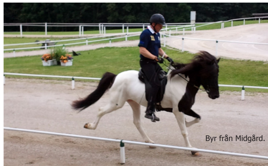
Byr frá Midgård.